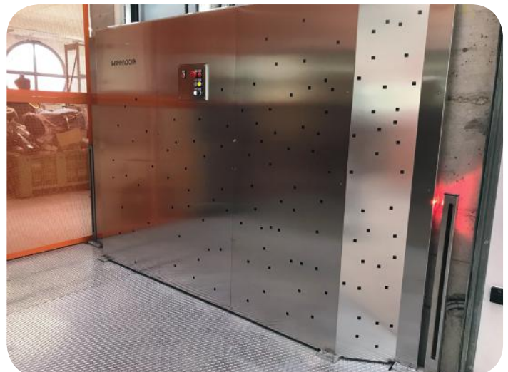
protezioni laterali personalizzabili ( es. acciaio inox, acciaio AISI e con logo personalizzato).