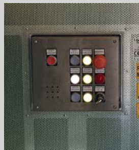
Bottoniera a bordo piattaforma (presente solo nella versione CCB)