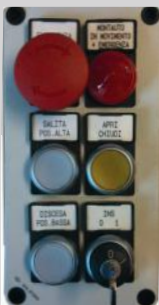
Bottoniera di piano versione standard