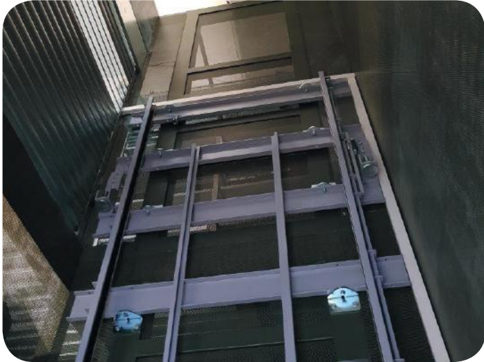
Installazione in castelletto metallico