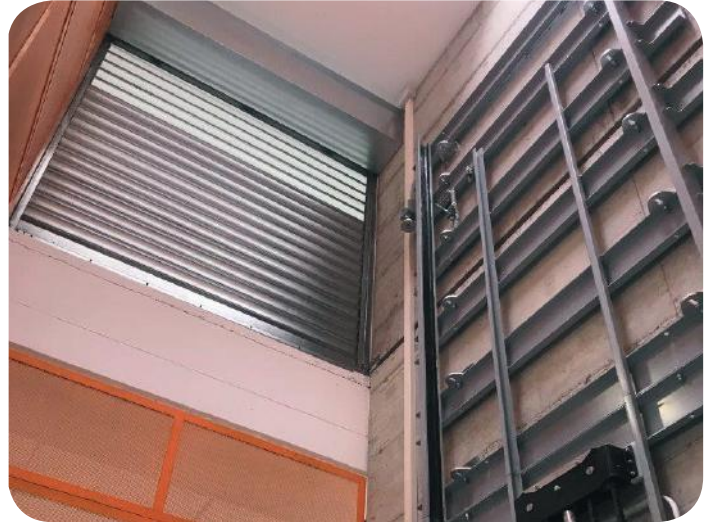
Installazione all'interno di un vano in C.A.