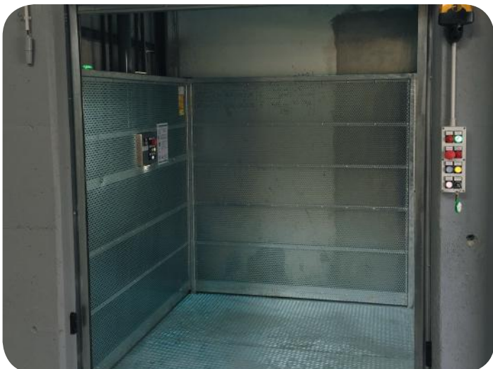
finitura standard per versione SCB/CCB